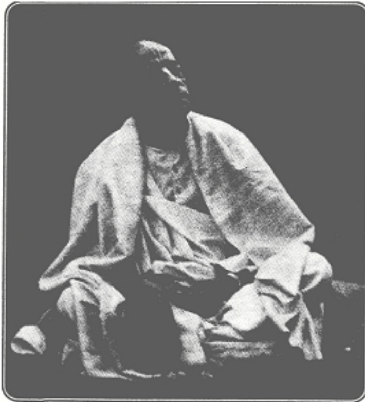
Srila A.C. Bhaktivedanta Swami Prabhupada

Fundador Acharya de la Sociedad Internacional por la Conciencia de Krishna